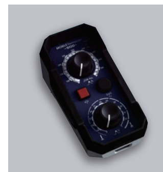
モバイルリモコン

溶接機用リモコンにより、溶接中でもアークの確認と溶接条件の調整が可能です。アークから目を離すことなく条件変更できるため、アークの細やかな変化を確認でき条件設定にかかる時間を削減します。